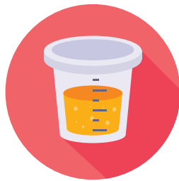
Análisis de proteínas en la orina (UACR)